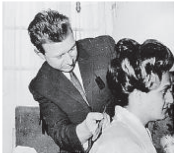
Pavillon Breite, Breitestr. 3. 14-16.30h.