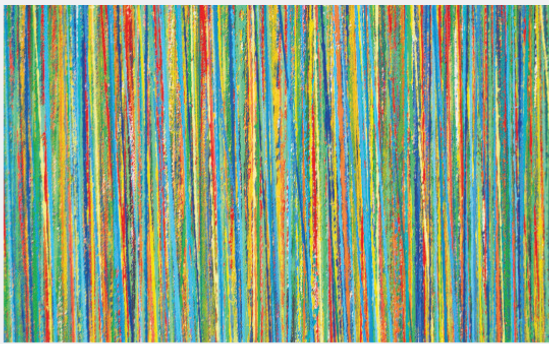
Was passiert, wenn zwei Farben aufeinander stossen? Eine wichtige Frage für die Künstlerin.

Apothek Bellevue 044 266 62 22 365 Tage 24 Stunden geöffnet