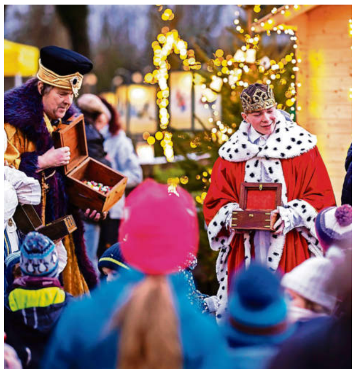
Einer der Höhepunkte war der Einzug der drei Könige.

Daneben gab es versteckte Goldvreneli zu gewinnen, die Kinder konnten sich ihr eigenes Dreikönigs-Holzobjekt brennen und gegen den Hunger bereitete das Team der Wirtschaft Obere Mühle Währschafes über dem offenen Feuer zu. red