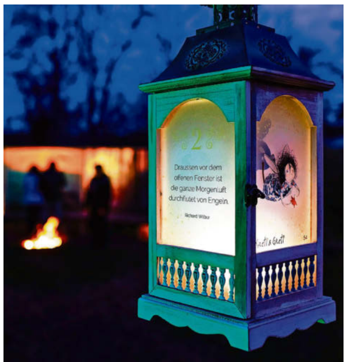
Die Dreikönigsfeier war ein rundum stimmungsvoller Anlass.