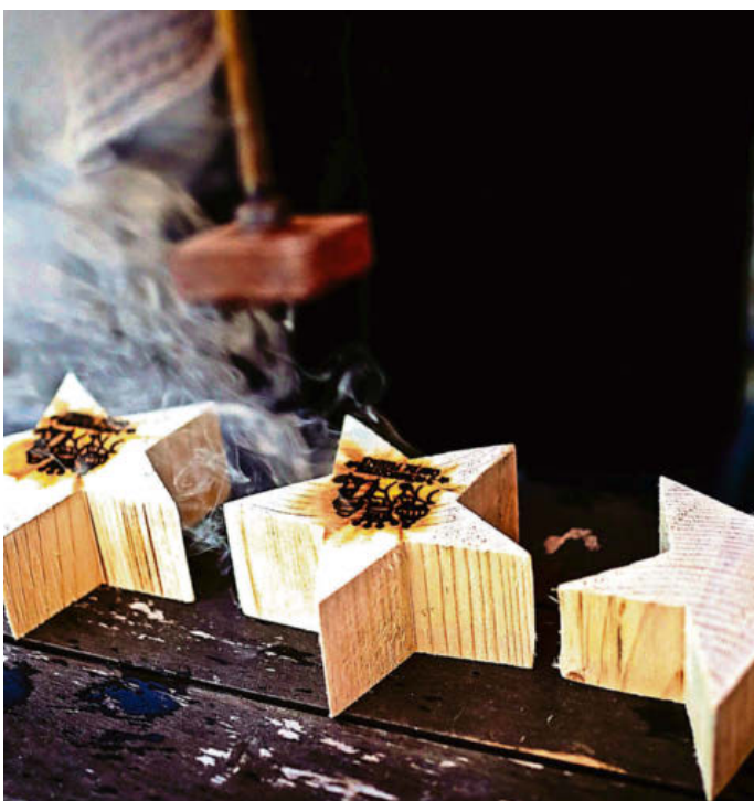
Auch auf kleine Details legten die Organisatoren viel Wert.