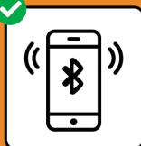
Um Infektions- ketten zu stoppen: SwissCovid App downloaden und aktivieren.