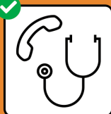
Nur nach telefonischer Anmeldung in Arztpraxis oder Notfallstation.