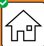
Bei positivem Test: Isolation. Bei Kon- takt mit positiv getesteter Person: Quarantäne.