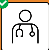
Bei Symptomen sofort testen lassen und zu- hause bleiben.