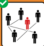
Zur Rückverfol- gung immer vollständige Kontaktdaten angeben.