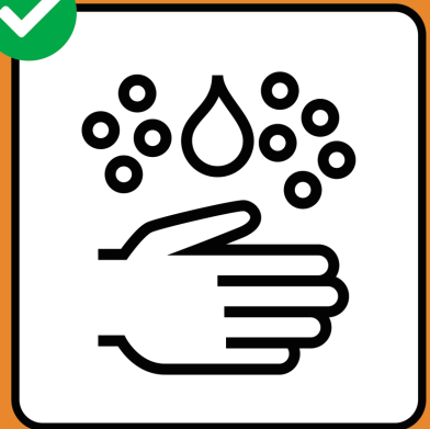
Gründlich Hände waschen.