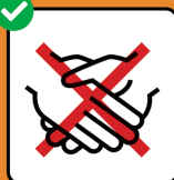
Hände schütteln vermeiden.