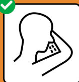
In Taschentuch oder Armbeuge husten und niesen.